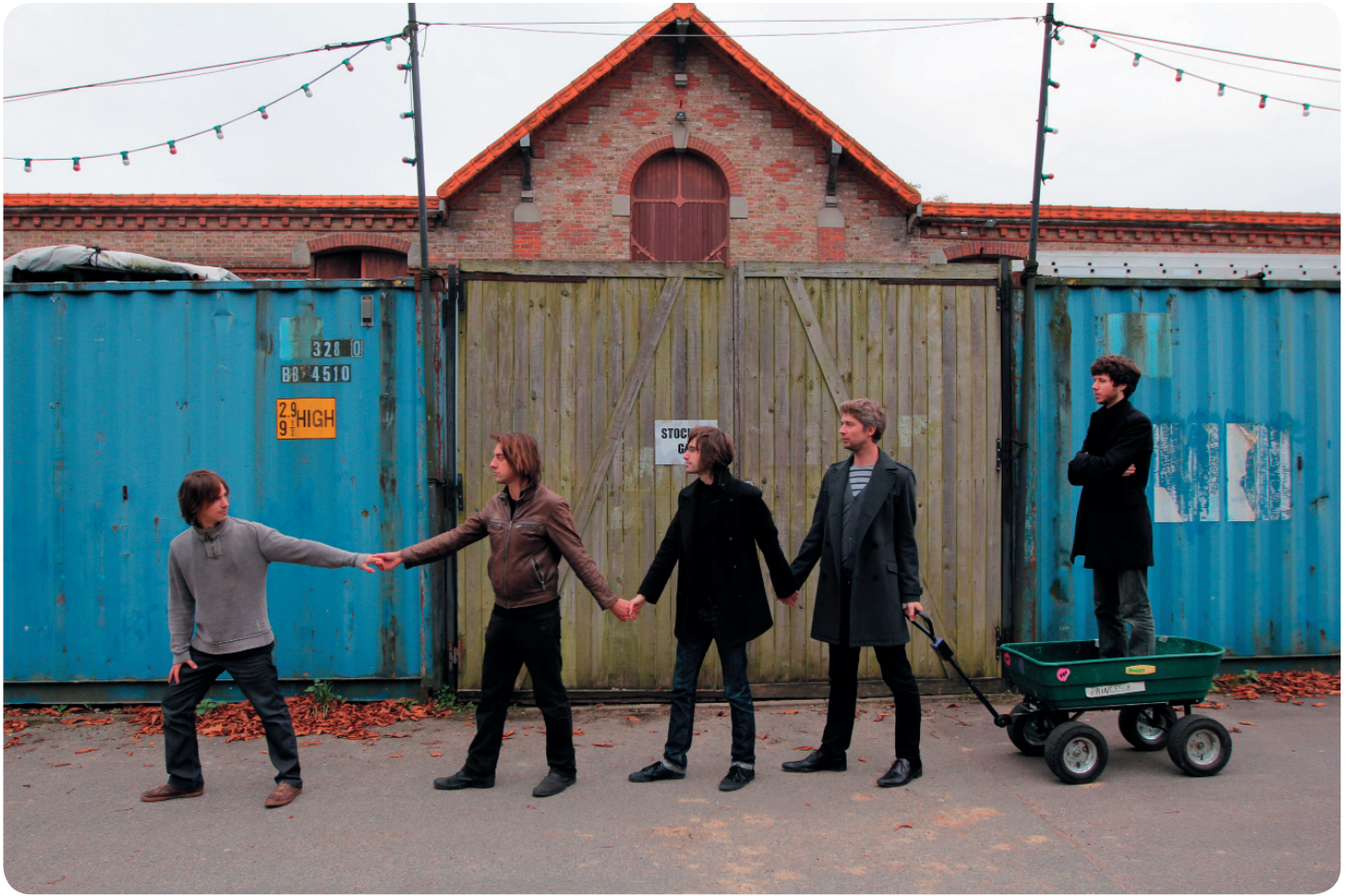
Le Cabaret Contemporain